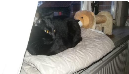
Ik ben nogal dominant, mijn vriend hier vindt dat niet irritant