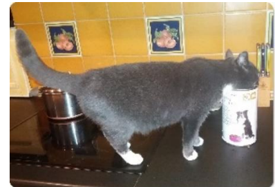
Nog geen potje dan maar een hondenbrokje