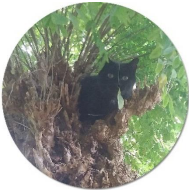
Leuk daar beneden, al dat poezenleven