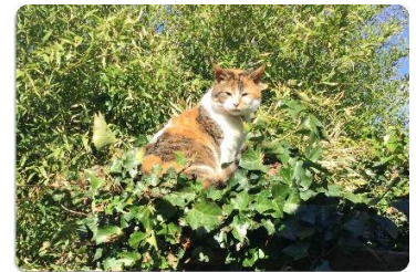
Rusten tussen de bladjes, weg van al die katjes