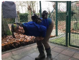
Komaan zeg, wat dollen en rollebollen