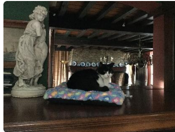
Op dit plaatsje pas ik wel in dat plaatje